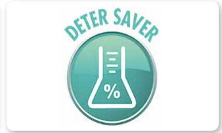
Dosatore detergente on board On board detergent dosing system Dosificación detergente a bordo