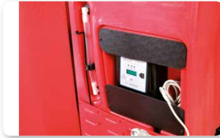
Scuotitore elettrico On-board battery charger Cargador de batería incorporado