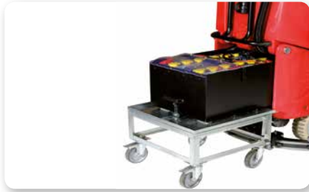
4 Batterie 6V-270 Ah(20h) con cambio rapido Quick-change 4x6V-270 Ah(20h) batteries 4 Baterías 6V-270 Ah(20h) con cambio rápido