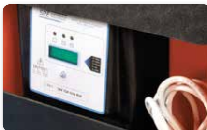
Carica batterie on board On-board battery charging Cargador de batería incorporado