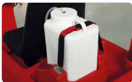
Dosatore detergente on board On board detergent dosing system Dosificación detergente a bordo