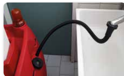
Tubo riempimento serbatoio Solutions filling hose Manguera llenado deposito